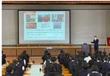
制服着こなしセミナー