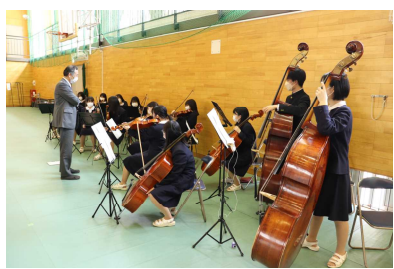
クラシック部演奏