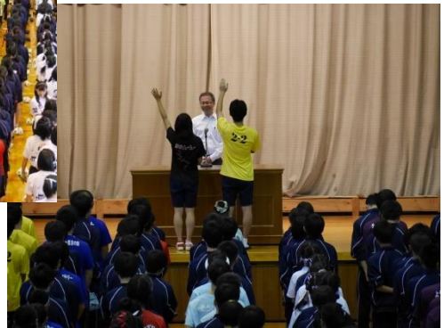
(「開会式」は肌寒く、黎明ジャージの上着着用が多くクラスTシャツが見えず、ちょっと“映えない”写真に…)